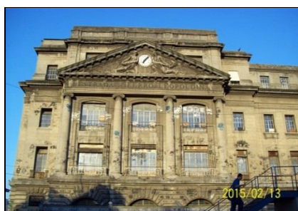
Acima, frente da estação Barão de Mauá totalmente pichada.

Outro caso de omissão foi ao ar dia 05/09 no RJ TV, que mostrou o estado lamentável da Estação Barão de Mauá, antiga sede da E. F. Leopoldina. Inaugurada em 1926 está de-sativada como estação desde 2001. A matéria abordou o despacho do Procurador da República, Sérgio Suiama, que ordenou ao Governo do Estado e Supervia fazerem obras emergenciais para evitar a queda de reboco e da marquise na entrada da Gare.